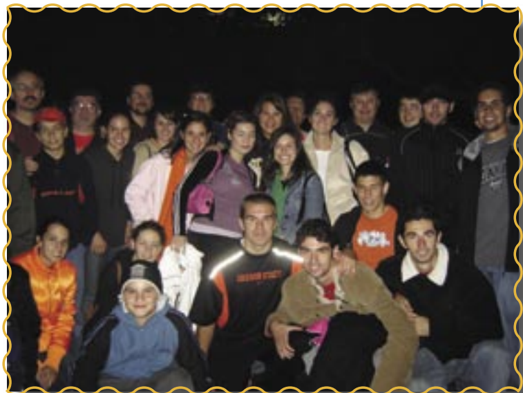
Cu tinerii de la Bethel, Los Angeles