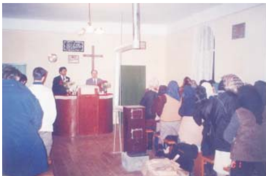
Sus: În Jamul Mic; Mijloc: În Barița; Jos: În Nicolinți.