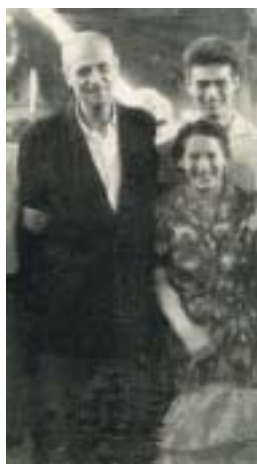
1965: Trăiască Domnul! Richard e liber !

asistenței cărțile pentru copii tipărite în limba din Laos și alte țări, el a menționat că aceste cărți nu au fost văzute tipărite de soții Wurmbbrand, rodul dragostei lor arătându-se și după moartea lor.