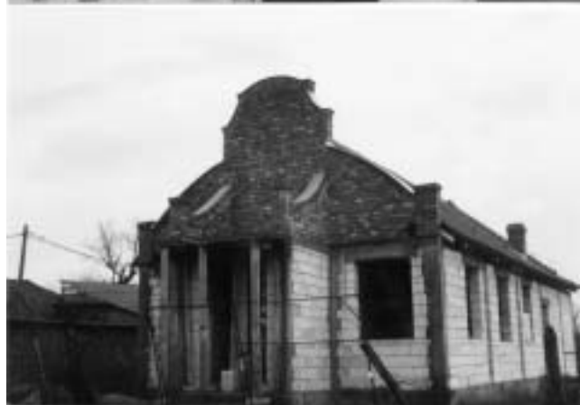
Botez la Ticvanul Mic; clădirea bisericii din Ticvanul Mare

urmat a fost atât de secetoasă încât 3 luni nu a căzut un strop de ploaie. N-au fost grâu, porumb, zarzavaturi, ci doar puține fructe. Nici iarna aceasta n-a adus nici ploaie nici zăpadă. Barajele și fântânile au secăt, apa fiind drastic raționalizată atât la orașe cât și la sate. Spiritual însă a fost un an de har: am organizat la Sasca Română, pe râul Nera, o tabără de 2 săptămâni cu tinerii din zona Caraș, la care am avut 165 de tineri, printre ei au fost și copii de la Orfelinatul din Prilipeș.